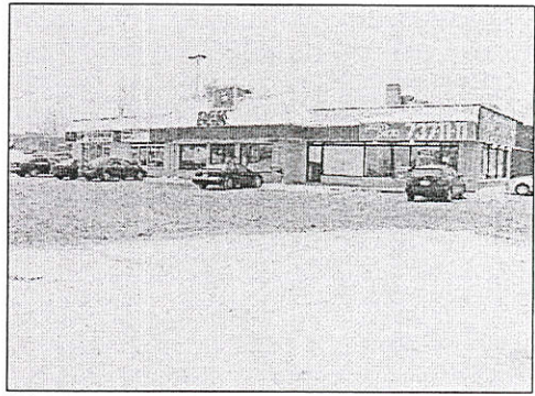
FAÇADE - 195 rue Principale, (Aymer) Gatineau, Qc.